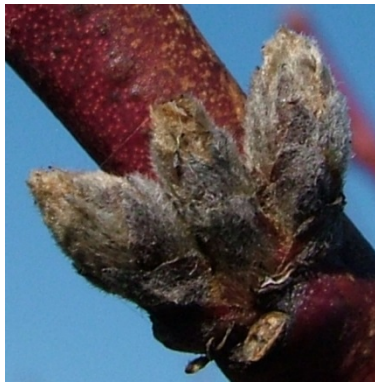
A (νωρίς) Κοιμώμενος οφθαλμός