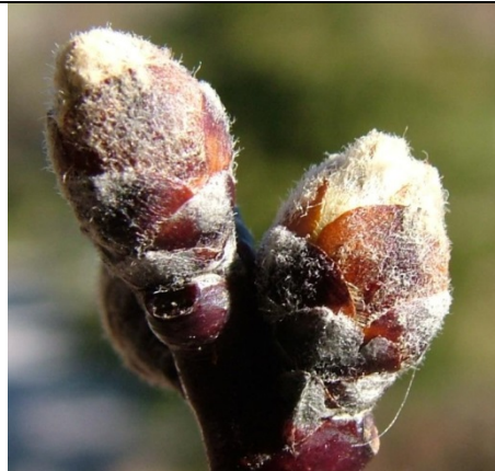
B (ιδανικό) Διόγκωση οφθαλμών