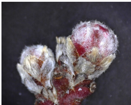
Εικόνα 1. Έναρξη του σταδίου C