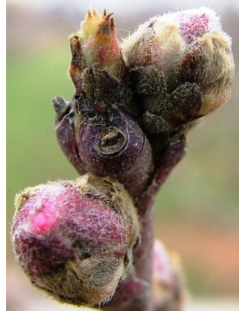
C (αργά) το πρώτο φύλλο προβάλλει ανάμεσα στα λέπια και φαίνεται από πλάγια