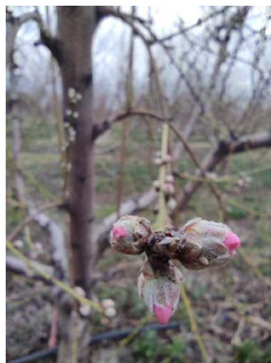
Πρώιμες ποικιλίες στην Πέλλα