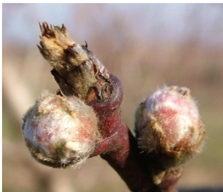
έναρξη C (οριακά) Εμφάνιση κάλυκα