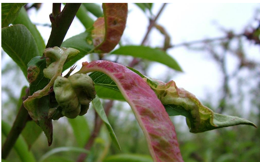
Προσβολή από Εξώασκο. Καρούλιασμα ολόκληρου του φύλλου προς τα κάτω ή μόνο του βασικού μέρους, κόκκινος μεταχρωματισμός του ελάσματος.

Ο Προϊστάμενος του Π.Κ.Π.Φ.Π. & Φ.Ε. Θεσσαλονίκης