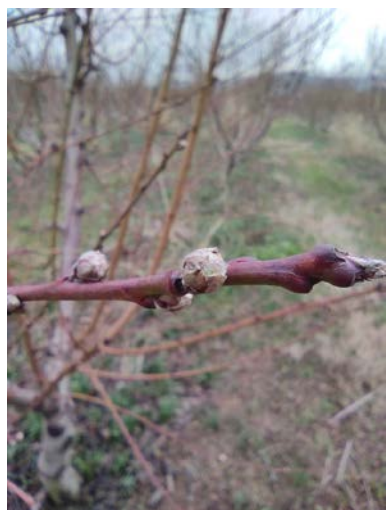
Ποικιλίες στην Ημαθία